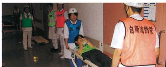
真剣に取り組む参加者

訓練は、初期消火、通報連絡体制、避難救助に重点を置いて行い、教職員約100名が参加しました。