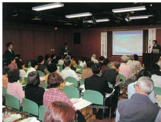
写真は昨年度の公開講座から