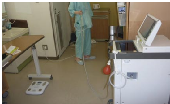
(図1) 体外式補助人工心臓