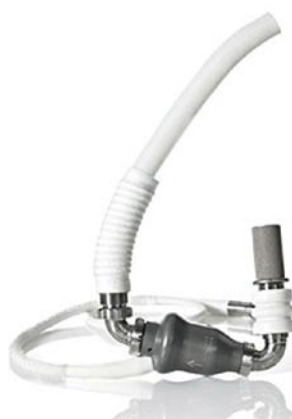
植込み型補助人工心臓 (Heart Mate II)