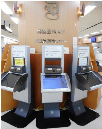
（写真 1） <再来受付機写真>

1 階の再来受付機（正面玄関）で受付を済ませてから外来採血室に来てください（写真 1）。