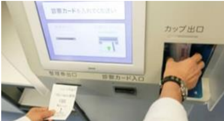
（写真 3） 受付機から採尿カップが出ます

診察券と整理番号を受け取ります。尿検査がある場合は採尿カップも出てきます（写真 3）。 整理券には採血番号が発行されています（写真 4）。