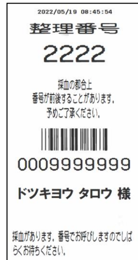
（写真 4） 採血整理券