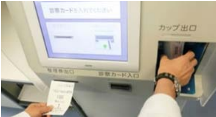
(写真3) 受付機から採尿カップが出ます

診察券と整理番号を受け取ります。尿検査がある場合は採尿カップも出てきます（写真3）。 整理券には採血番号が発行されています（写真4）。