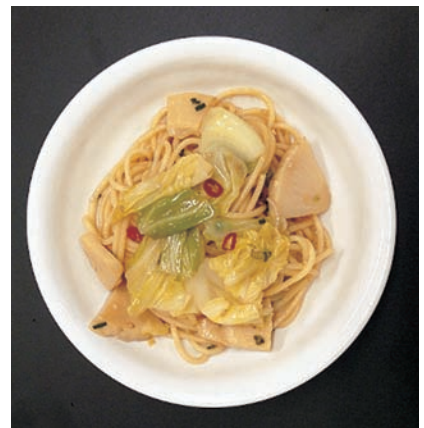
春キャベツとたけのこのパスタ