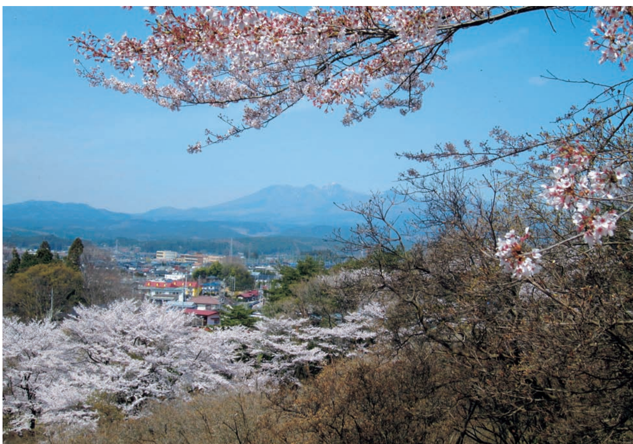
高原山（栃木県日光市）