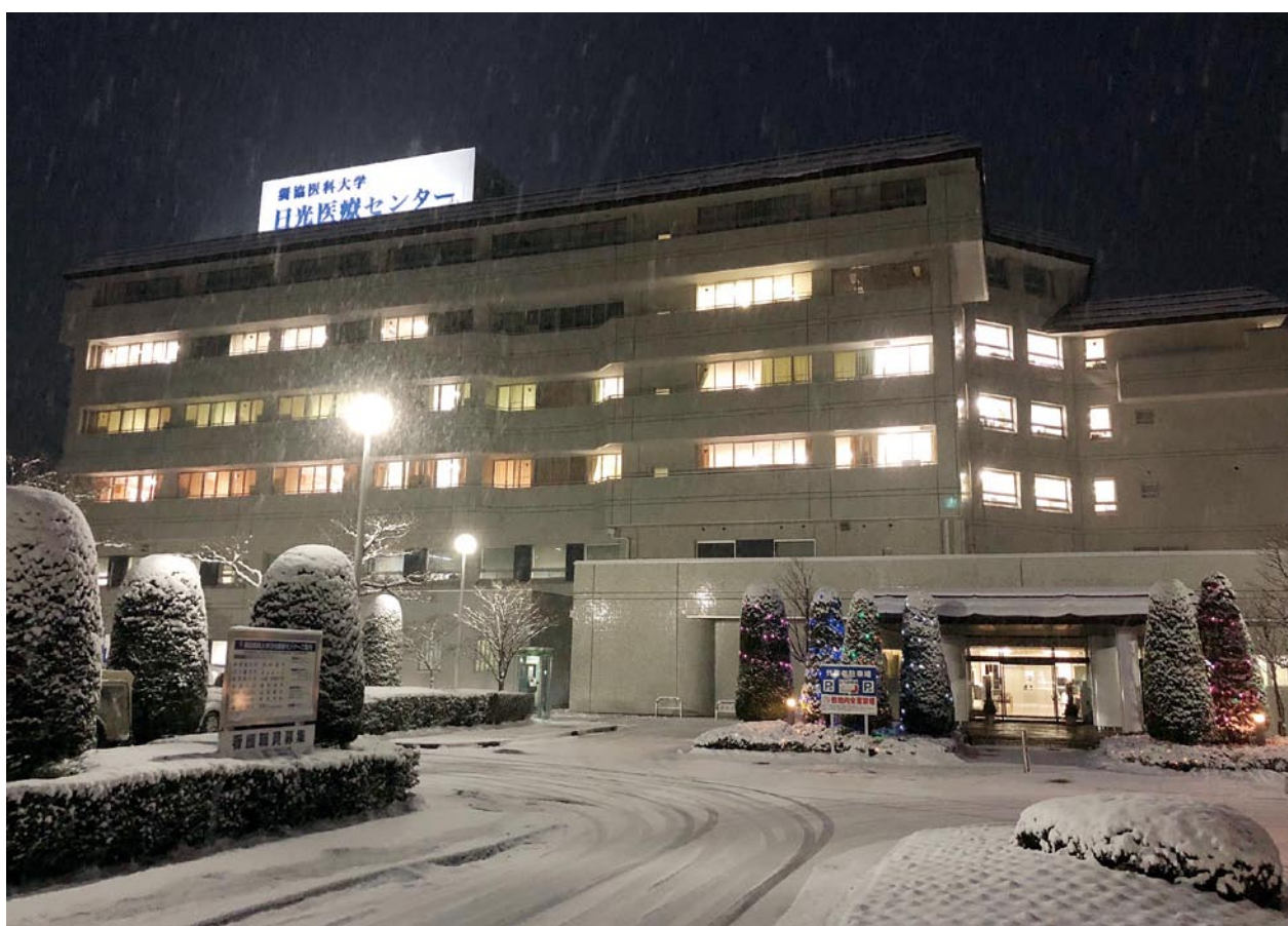
獨協医科大学日光医療センター（栃木県日光市）