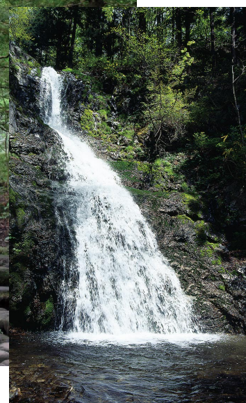
滝尾神社／白糸の滝（栃木県日光市）