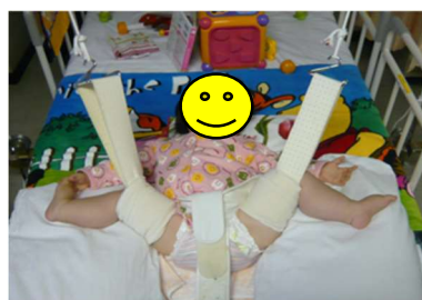
オーバーヘッドトラクション