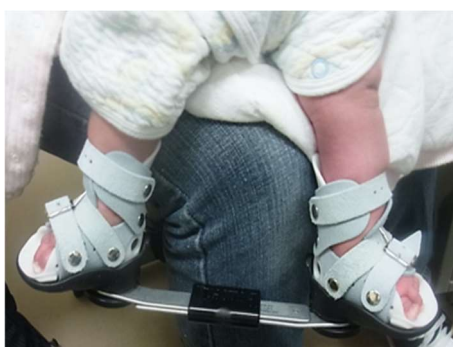
Ponseti 法によるギプス矯正および足部外転装具による治療