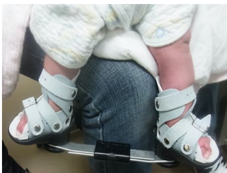
Ponseti 法によるギプス矯正および足部外転装具による治療