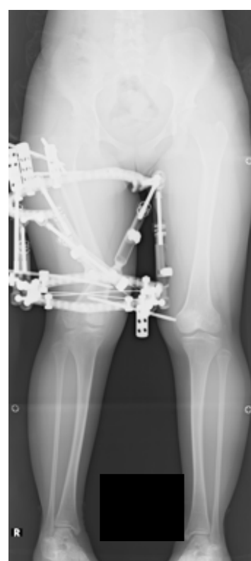
右内反膝および脚短縮に対する創外固定による骨延長および変形矯正