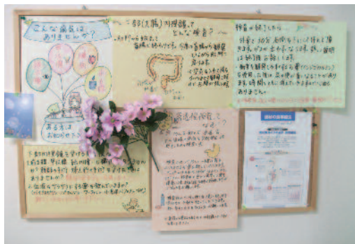
透視検査用掲示物

我々スタッフ一同は患者様の協力のもとに安全な検査を心掛けております。 放射線検査について何か疑問な点がありましたら、スタッフにお気軽に声を掛けてください。