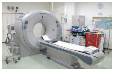
東芝製64列マルチスライスCT

放射線の検査を行うに当たっては、患者様の協力が大変重要になりますので、検査方法を例を挙げて紹介いたします。